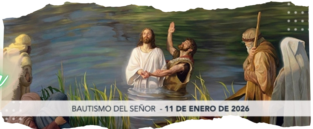
BAUTISMO DEL SEÑOR - 11 DE ENERO DE 2026