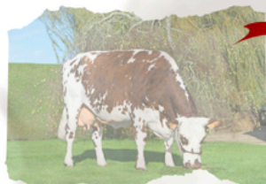
NOVILLA RAZA NORMANDO

JUGÓ EL 30 DE NOVIEMBRE Nro Ganador 7575