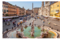
PLAZA NAVONA EN ROMA