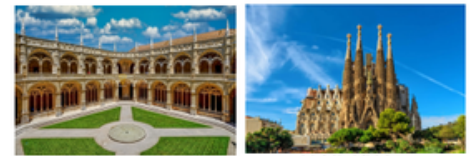
MONASTERIO DE LOS JERONIMOS EN LISBOA

¡UN FELIZ VIAJE E BIENCHONES PARA TODOS!