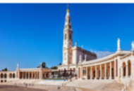
SANTUARIO DE FATIMA

ABRIL 29. - SANTIAGO DE COMPOSTELA. Desayuno. Por la mañana se realizará una visita de la ciudad incluyendo la Plaza del Obradoiro. Posibilidad de asistir a la Santa Misa en la Catedral, considerada como una de las más importantes del mundo. Tarde libre para pasar por esta hermosa ciudad, a bien conocer las Rías Aza y la atractiva ciudad de La Coruña. Regreso al hotel, cena y alojamiento.