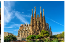
BASILICA DE LA SAGRADA FAMILIA