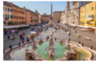
PLAZA NAVONA DE ROMA

ABRIL 22. - A la hora indicada cita en el aeropuerto El Dorado para tomar el vuelo Bogotá - Madrid - Roma.