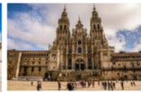
CATEDRAL DE SEVILLA