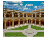
MONASTERIO DE LOS JERONIMOS EN LISBOA

LUN FELIZ VIAJE Y BENEDICIONES PARA TODOS!