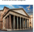
EL PANTEON ROMANO