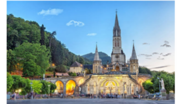
SANTUARIO DE LOURDES

ABRIL 30. SANTIAGO DE COMPOSTELA - COVADONGA - SANTANDER. Desayuno y salida hacia el Principado de Asturias. Se ascenderá a Covadonga, lugar donde dio comienzo la Reconquista de España. Allí se encuentra el Santuario y la célebre gruta con la imagen de la Virgen. Se proseguirá viaje hacia Santander, atractiva ciudad de verano, con sus maravillosos paisajes y playas de arena blanca. Recorrido panorámico y continuación al hotel. Alojamiento y cena.