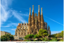
BASELICA DE LA SAGRADA FAMILIA