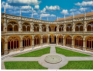
MONASTERIO DE LOS JERONIMOS EN LISBOA

LUN FELIZ VIAJE Y BIENVENIDOS PARA TODOS!