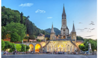
SANTUARIO DE LOURDES

ABRIL 30. SANTIAGO DE COMPOSTELA - COVADONGA - SANTANDER. Desayuno y salida hacia el Principado de Asturias. Se ascenderá a Covadonga, lugar donde dio comienzo la Reconquista de España. Allí se encuentra el Santuario y la cábrega gruta con la imagen de la Virgen. Se proseguirá viaje hacia Santander, atractiva ciudad de verano, con sus maravillosos paisajes y playas de arena blanca. Recorrido panorámico y continuación al hotel. Alojamiento y cena.